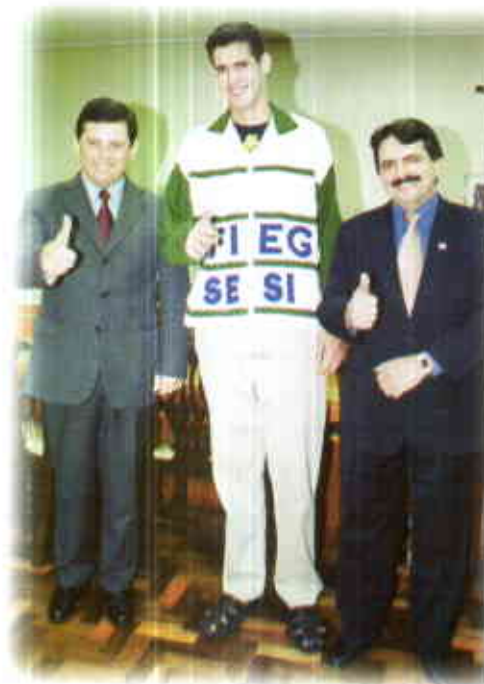
...recebendo apoio do governador Marconi Perillo

Em 1999, mais de 32.232 desportistas utilizaram as instalações sesianas para a prática físico-esportiva. Além disso, a entidade promoveu 5.398 atividades artísticas, culturais e esportivas, cumprindo a função de proporcionar um lazer sadio e de integração entre os associados e a comunidade. ■