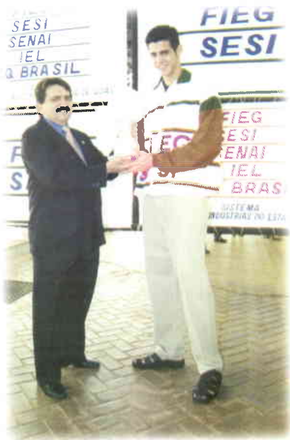
...homenageado pelo presidente da Federação das Indústrias, com o troféu "Mérito Esportivo Sistema Fieg"...