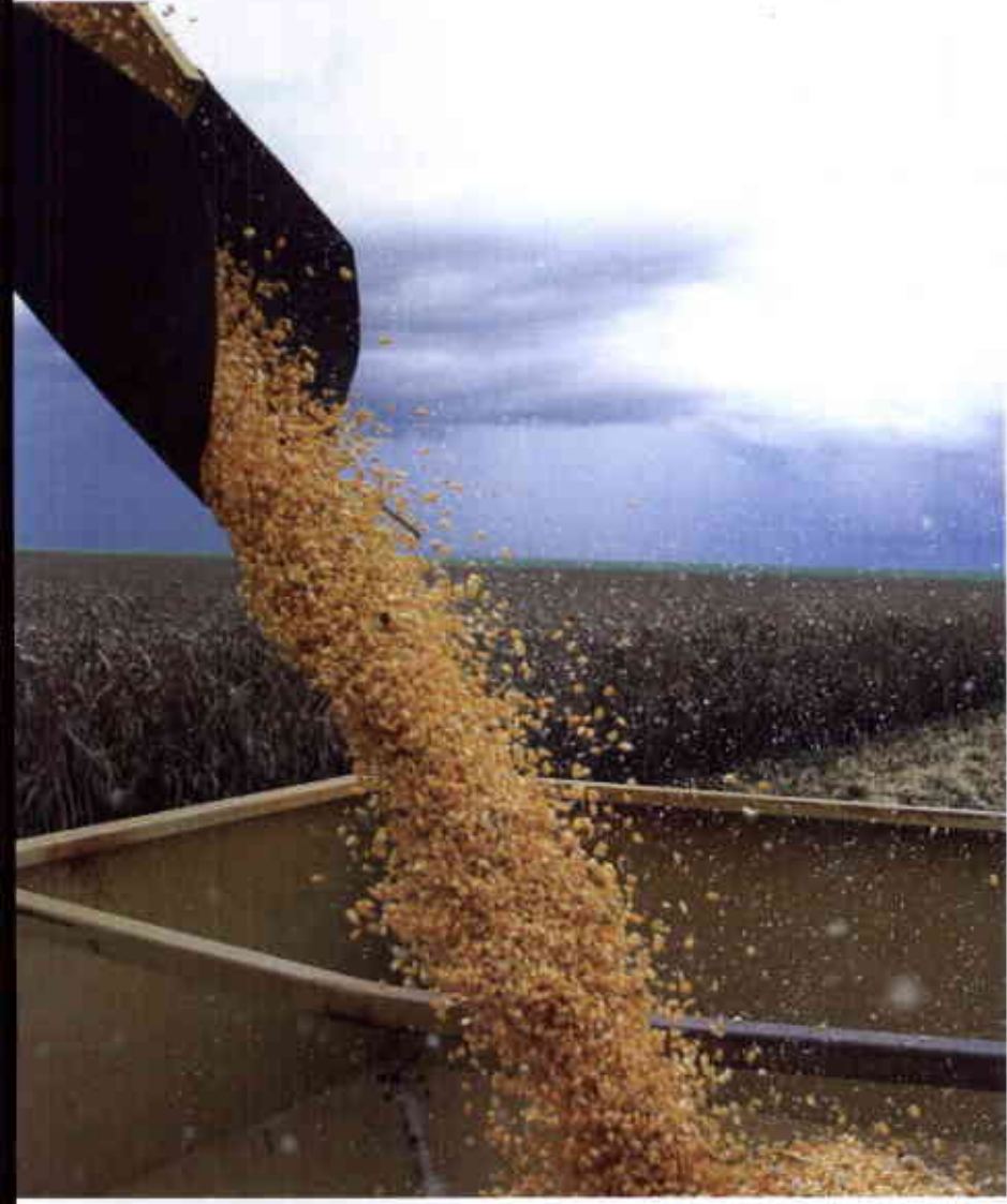
Milho e soja: avanço da produção no Cerrado atraiu as atenções de grandes agroindústrias para o Estado