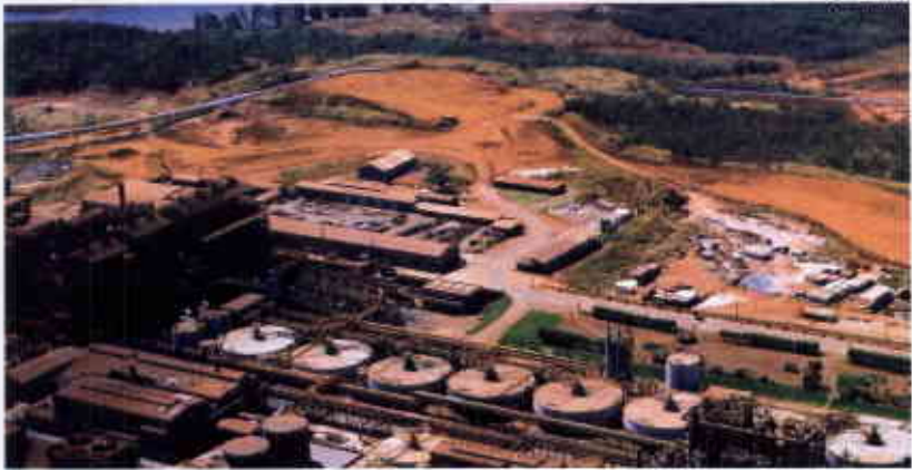
Indústria extrativa: participação do setor encolheu nos últimos anos, antes do recente boom de investimentos