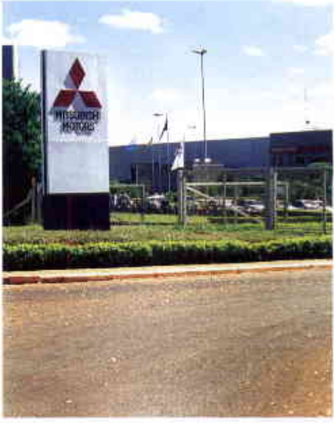
Mitsubishi: compra de nova área sinaliza planos para futuras expansões em Catalão