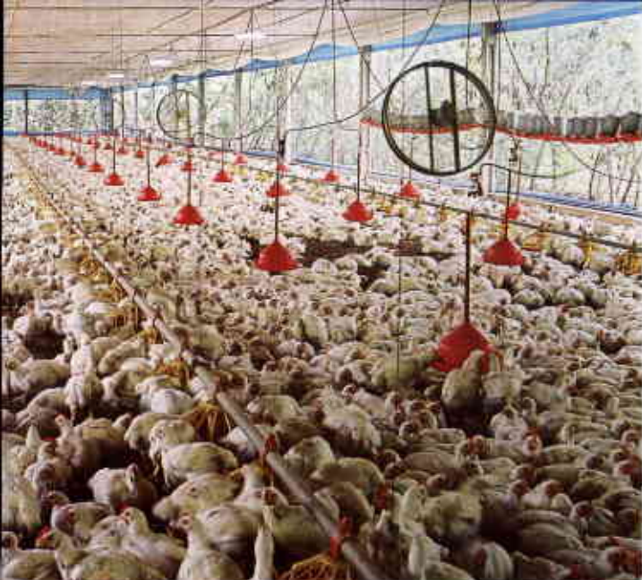
Avicultura: Perdigão anuncia novo pacote de investimentos de R$ 1,1 bilhão em três anos