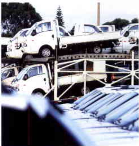
Caoo/Hyundai: projeto contrata créditos do ICMS no valor de R$ 4,46 bilhões